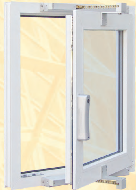
SHD 54/450-BSY+ mit / with FRA 11-BSY+